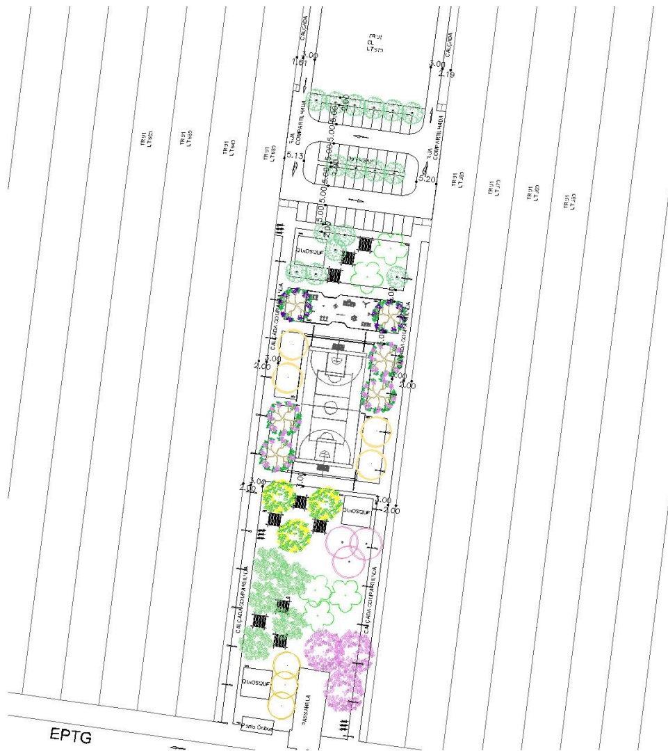
Figura 5 - Sugestão de especialização das diretrizes

Tais diretrizes podem ser especializadas conforme figuras 5 e 6, a seguir: