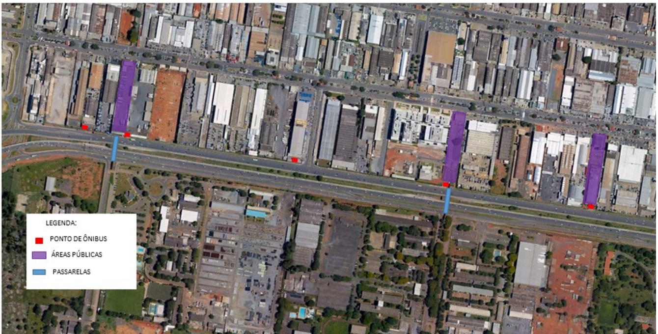
Figura 4 - espaços públicos no SIA.

Assim, essa CPA/EIV recomenda que a revitalização da área pública configure o espaço como um local de permanência para os usuários e sua vocação como espaço de passagem, respeitadas as diretrizes indicadas no item 4.