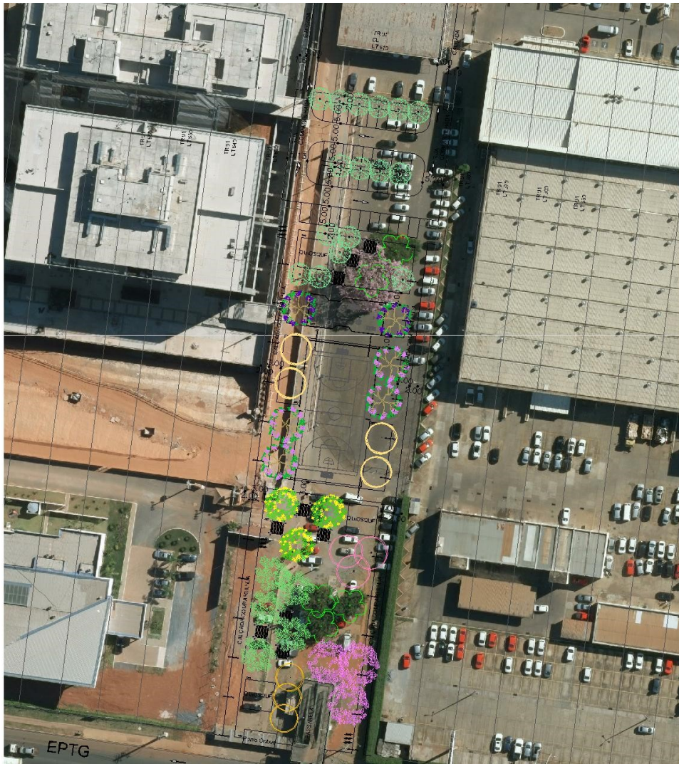
Figura 6 - Sugestão de espacialização das diretrizes