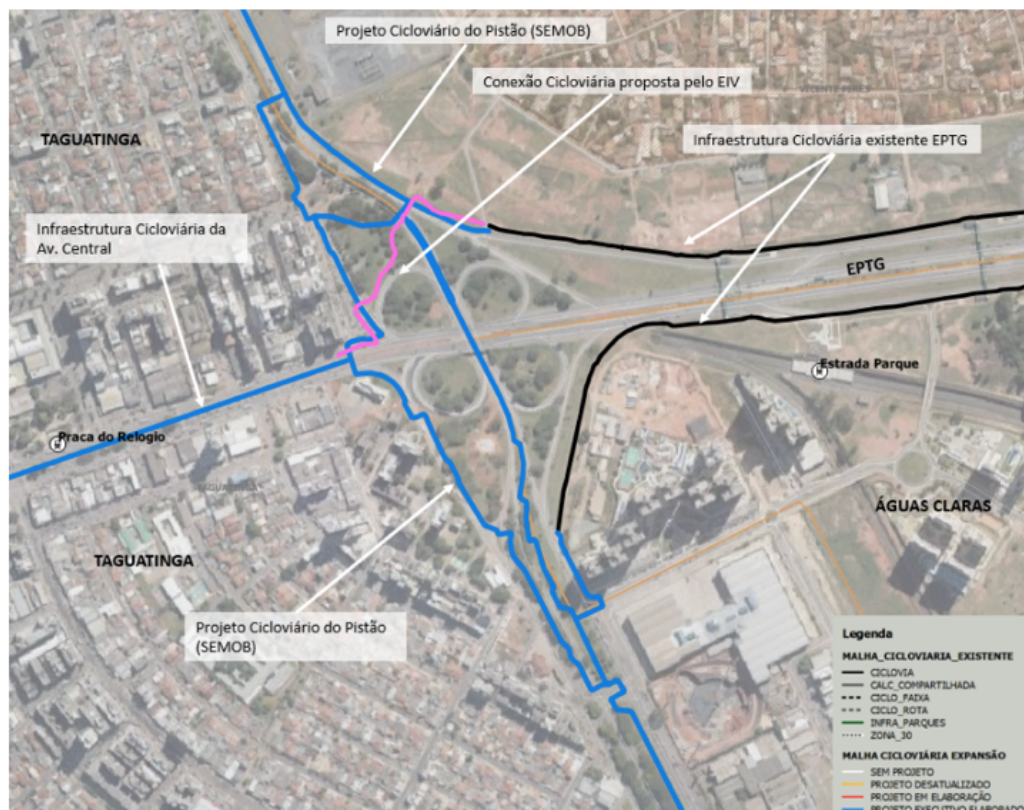
Fig. 03: Indicação de rotas - projeto da SEMOB. Fonte: SEMOB

A imagem abaixo indica, em azul, o traçado do projeto existente na SEMOB: